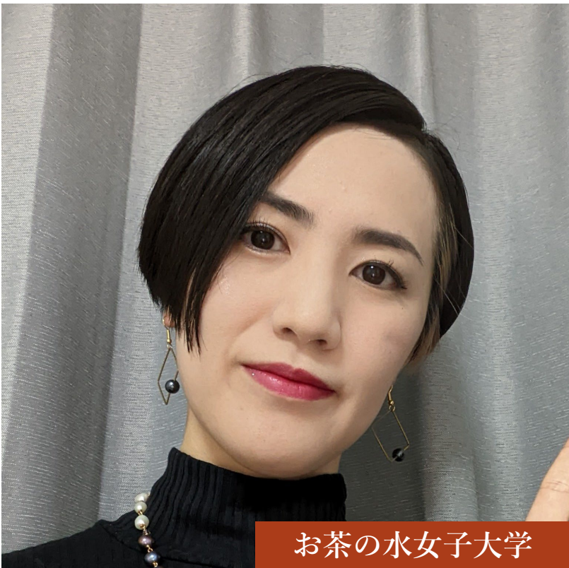
お茶の水女子大学